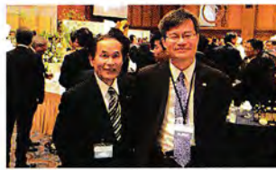
ノーベル賞受賞者 天野浩先生と