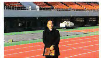
瑞穂スタジアムの建て替え調査