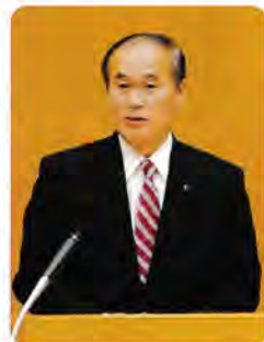
県議会議員 新海 正春