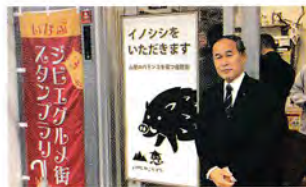
ジビエ猪鹿工房山恵の視察