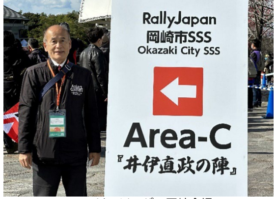
ラリージャパン岡崎会場