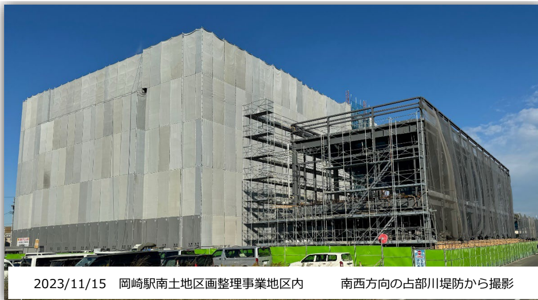
2023/11/15 岡崎駅南土地区画整理事業地区内 南西方向の占部川堤防から撮影

○本館棟 鉄骨造地上5階建 延べ面積 7,581.85㎡ 2024年秋 完成予定