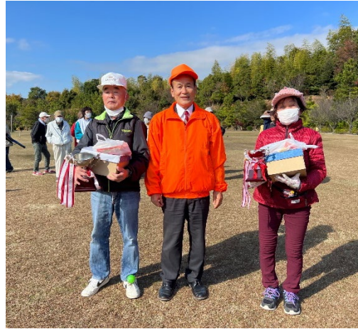
第7回しんかい杯GG大会