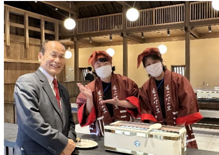
じぶりパーク「もののけの里タタラ場」