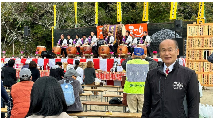
めかたふるさとまつり