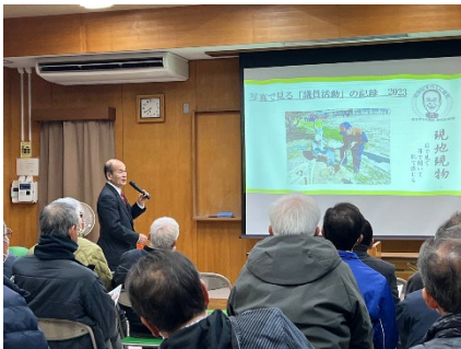
六ツ美中部 県政報告会