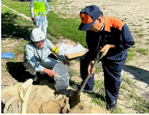
地区防災総合訓練