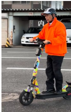
電動キックボード体験