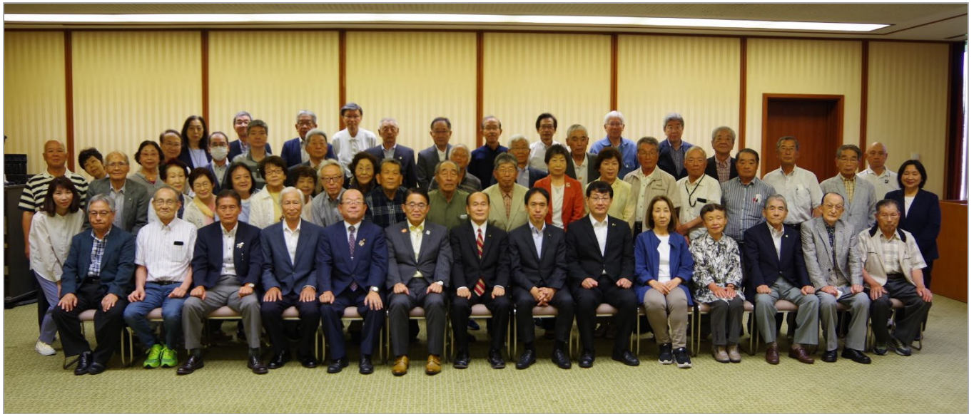
後援会連合会主催 6月定例愛知県議会傍聴 6/21