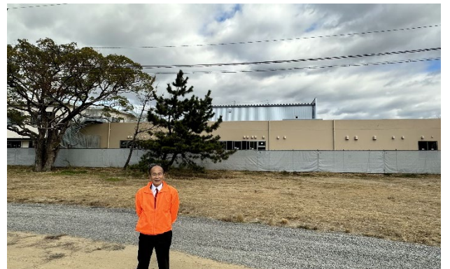
愛知県立岡崎特別支援学校新築工事現場