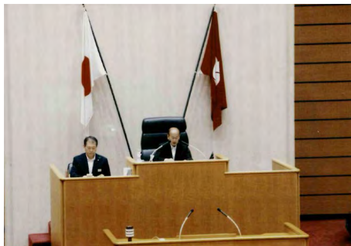
▲ 新議長選挙で最後の議長を務めました 5/22