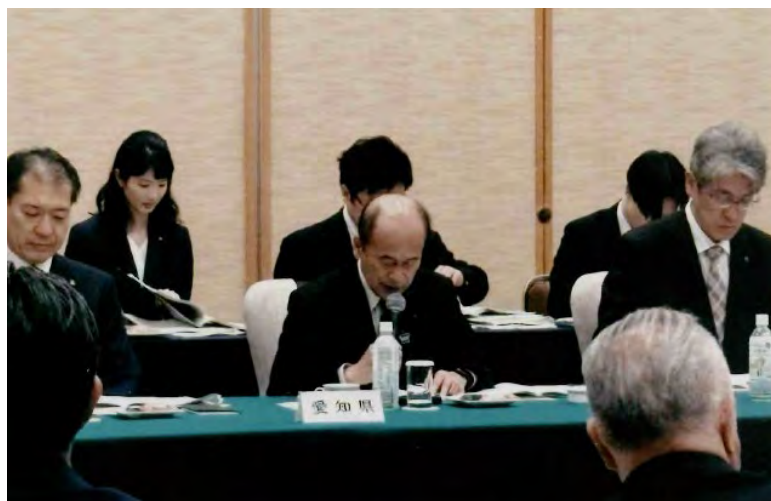
▲13 都道府県議会議長会議 4/22 ホテルオークラ福岡